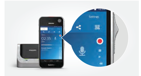
SpeechAir smartes Diktiergerät