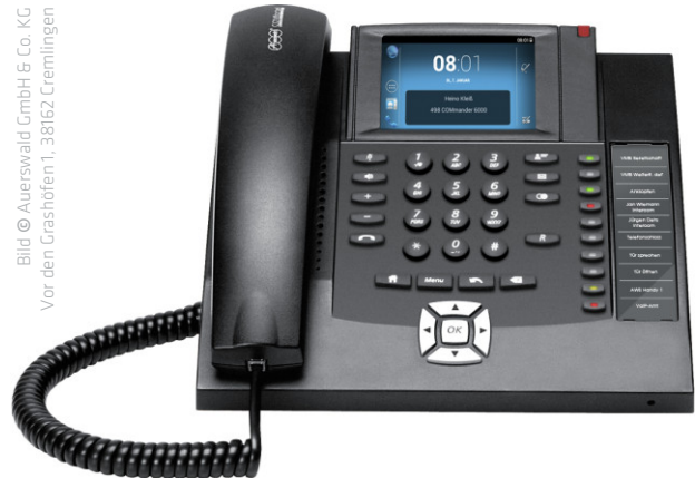
Empfohlenes Telefon von Auerswald für Anschluss an Fidentity