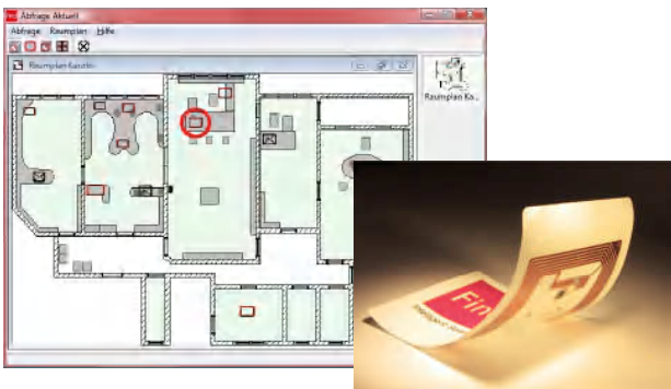
Anzeige des Aktenstandortes im Raumplan durch RFID-Transponder (optional)

Findentity wird vollständig nach Ihren Wünschen zusammengestellt und eingerichtet. Optional schaffen RFID-Transponder (Radiofrequenz-Identifikation) oder Barcodes eine nahtlose Verbindung von Papierakten, Inventar und anderen Objekten zur EDV. Durch die Erkennung wird jeder Arbeitsvorgang, jedes Diktat und Dokument automatisch zugeordnet und Objekte können sofort lokalisiert werden.