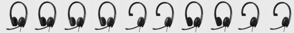
ADAPT 160T ANC USB ADAPT 160T ANC USB-C ADAPT 165T USB II ADAPT 165T USB-C II ADAPT 135T USB II ADAPT 135T USB-C II ADAPT 160T USB II ADAPT 160T USB-C II ADAPT 130T USB II ADAPT 130T USB-C II